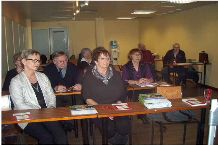
Leppävirran vuosikokouksen osanottajia