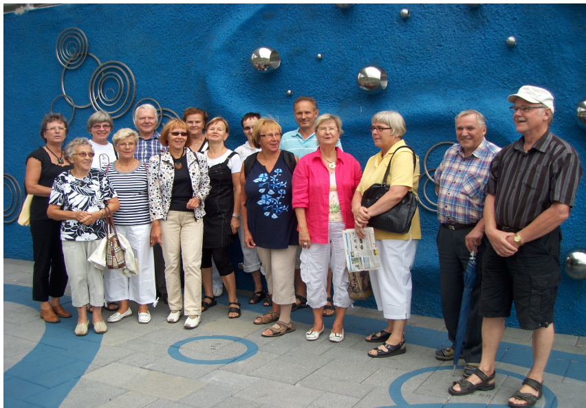
Asuntomessut kiinnostivat senioreita

Itä-Suomen alaosaston kesän päätapahtuma oli tutustuminen Kuopion Asuntomessuihin 10.8.2010. Messuille mentiin ja sieltä palattiin perinteisellä kuopiolaisella sisävesilaivalla. Asuntomessut oli vuoden suur tapahtuma Kuopiossa.