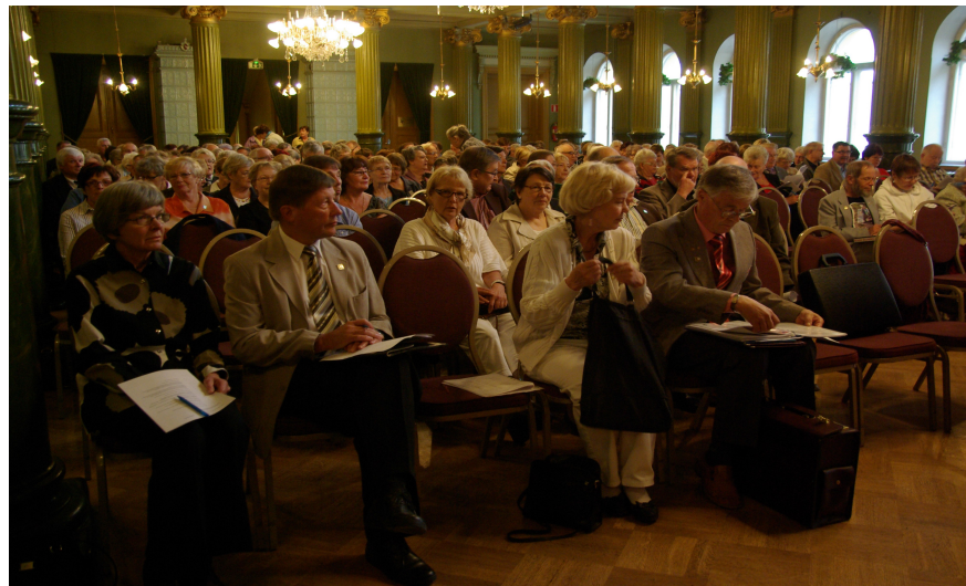
50-vuotisjuhlakokouksen osanottajia Turun VPK:n talossa