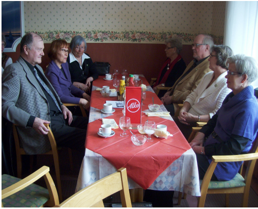
10-vuotisjuhlalounaan osanottajia ravintola Kallaveessä