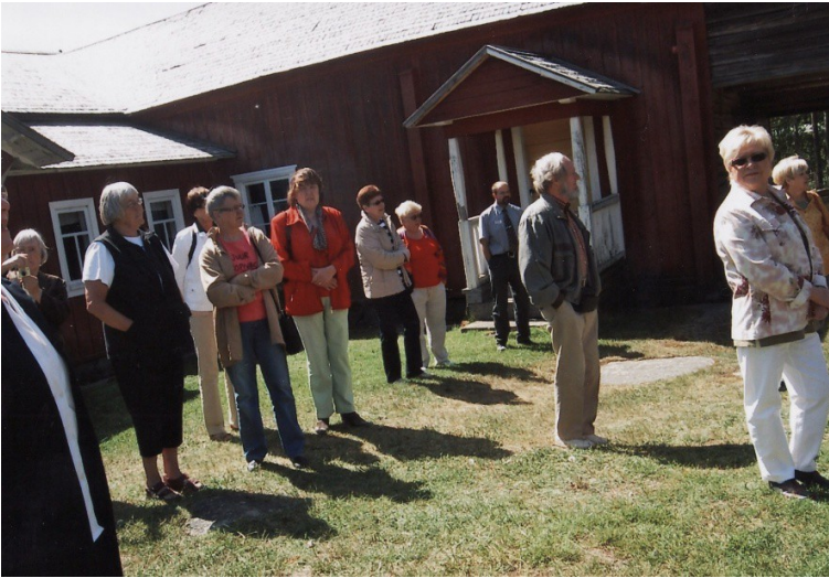
Kesäretki suuntautui tänä vuonna Laitilaan, jossa käytiin muun muassa Perinne kylässä.