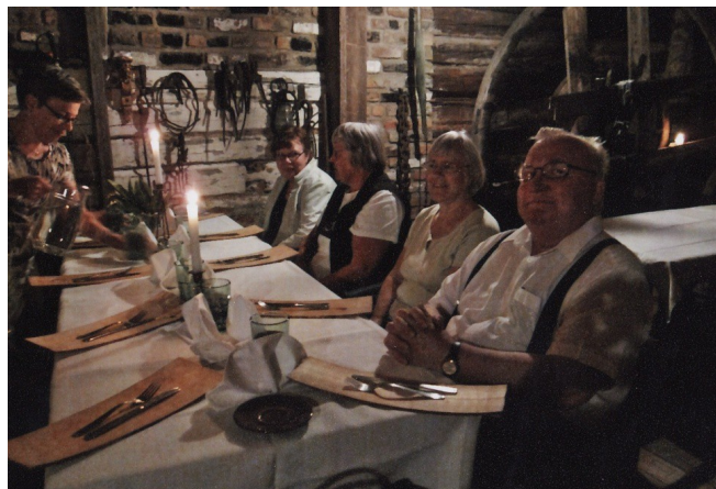
Kesäretki suunnattiin nyt Kankaanpään ja matkalla käytiin syömässä Pettu- Eerikin Hovissa

Rauman Teatterissa käytiin katsomassa musikaalia "Lainahöyhenissä" ja teatteridinneri oli perinteen mukaisesti Villa Tallbossa.