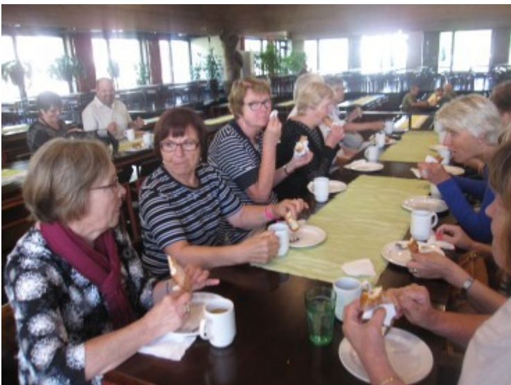
Säkylän varuskunnassa munkkikahvilla

Jäsenistöämme on muistettu merkkipäivinä sekä uusia eläkeläisiä.