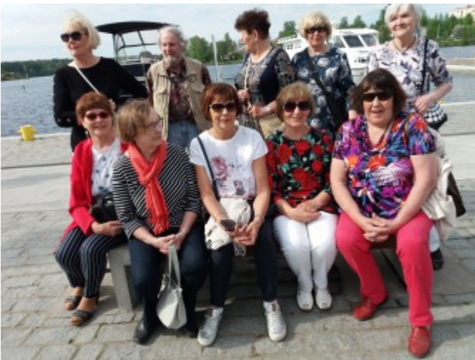
Vuosikokous osallistujat Savonlinnassa

Pikkujoulujuhlat vietimme turkulaisten kanssa Turun VPK:n talolla, hyvän ruoan ja juomien kera. Unohtamatta tanssia ja muuta ohjelmaa.