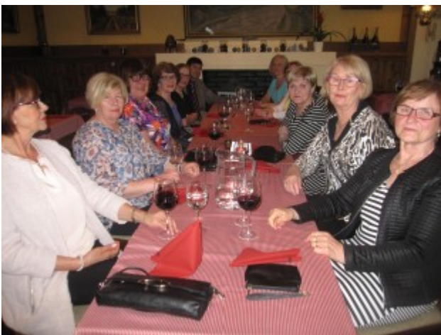
Joulujuhlaa viettämässä Turussa