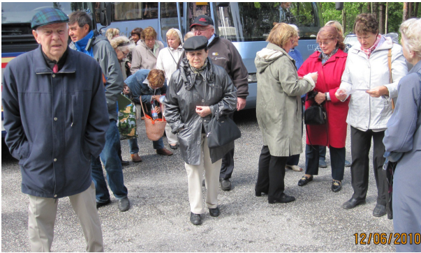
Rauman kesäteatterissa oli kesällä melko tuulista ja kylmää.

Rauman Teatterissa kävimme katsomassa "Alivuokralaisia" ja kesäretkellä Kauttualla.