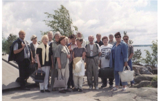
Kävimme kesäisellä meriretkellä Kuuskajaskarilla ja palasimme makoisan raumalaisen lounaan jälkeen takaisin Poriin.