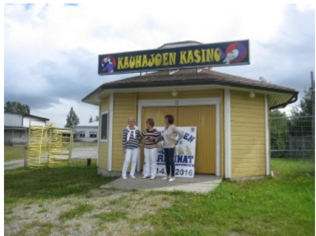
Kauhajoen Kasinolla muisteltiin nuoruutta