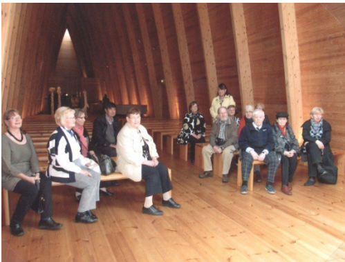
Hirvensalon Ekumeeninen Kappeli

Kesäretki tehtiin Kristiinankaupunkiin. Syksyllä kävimme kulttuurimatalla Turussa tutustumassa Kulttuurikeskus Lokomossa ja Hirvensalon kappelissa. Syömässä kävimme Aurajoella Ravintolalaiva Musta Rudolfilla. Paluumatkalla jäi vielä ostosaikaa Raision Mylly kauppakeskuksessa.