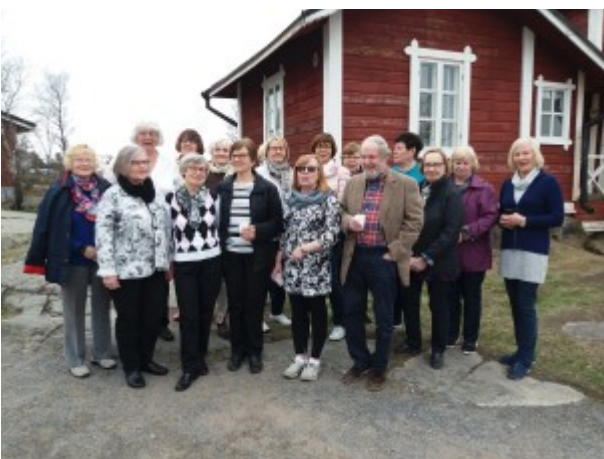
Retkeläiset Merikahvilla Kallon Valossa

Kutsuimme Turun alaostaston seniorit joulujuhlaan, jotka vietimme Suotaustan museolla Eurassa ja hauskaa riitti.