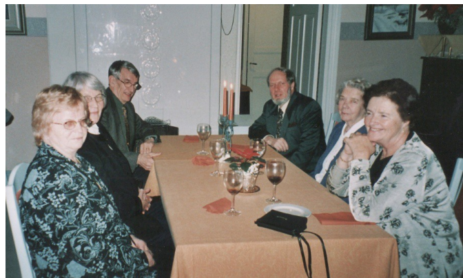
Teatteri-illallinen Villa Tallbossa

Teatterimatalla Raumalle nautittiin siitä, ”Kuinka rakkaus alkaa”.