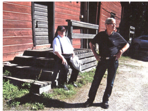
Kauttualla hellettä piisasi.

Suontaustan museolla poikettiin syömässä.