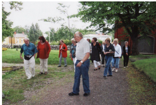
Menossa Kristiinankaupungin vanhaan kirkkoon

Marraskuussa kuultiin esitelmä Porin murteesta.