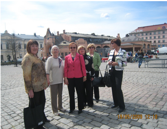
Tässä ollaan Kuopion torilla.

Vuosikokoukseen Kuopiossa osallistui 7 henkilöä.