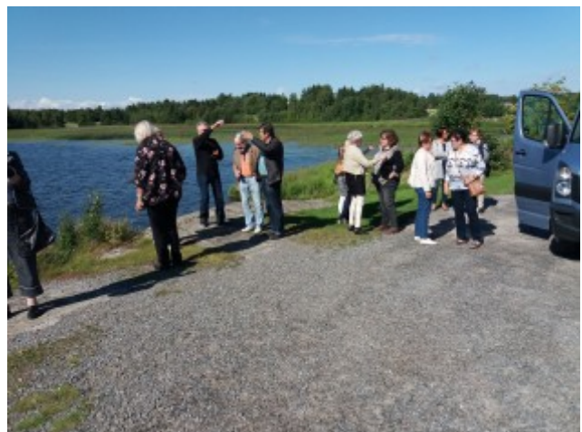
Ihailemme Pyhän Olavin kirkon maisemia