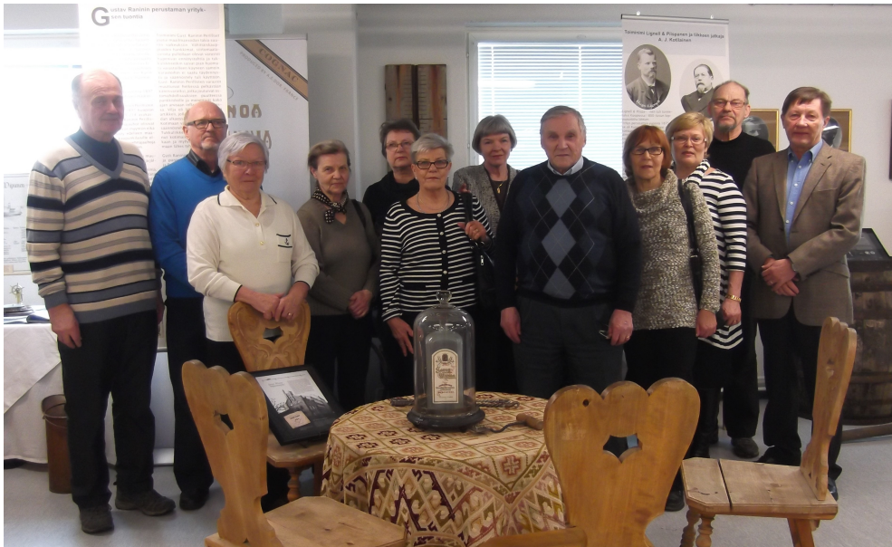
Lignell & Piispanen vieraina