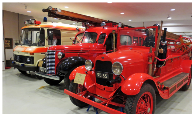
Kuopion Palomuseon autokalustoa