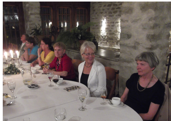
Juhlailallinen Narvan linnassa