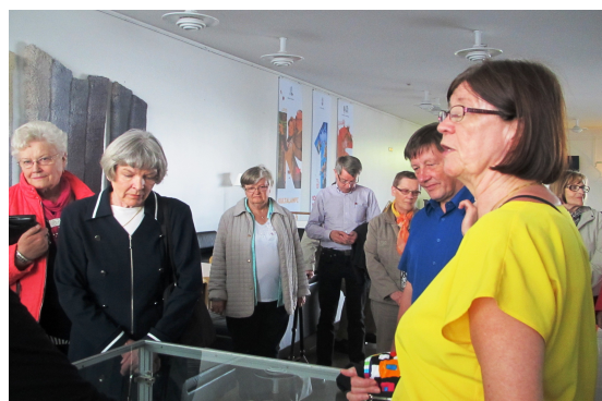
Seinäjoen vuosikokous 2014