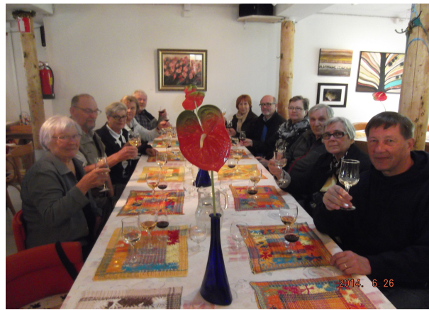
Alahovin viinitilaristeily m/s Ukolla