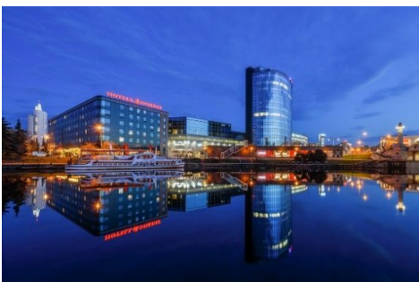
Majapaikkamme Tartossa hotelli Dorbat.

Kartanoon tutustumisen jälkeen jatkoimme matkaa etelään puurakennuksistaan, kauniista luonnostaan ja perinnesiikkifestivaalistaan tunnetun hyvin vanhan Viljandin kaupungin sekä sitten läheisen Võrtsjärven rantojen kautta itään kohti Tarttoa, jonne illansuussa saavuimme. Illalla tutustuimme kukin tavallamme kaupungin tarjontaan.