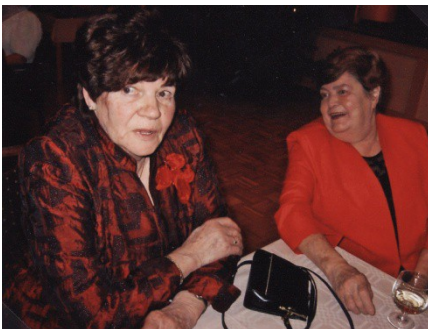
Joulujuhlaa vietimme Loimaalla Turun seudun eläkeläisten kanssa.

Jäsenistömme merkkipäiviä on jälleen muistettu eri tavoin.