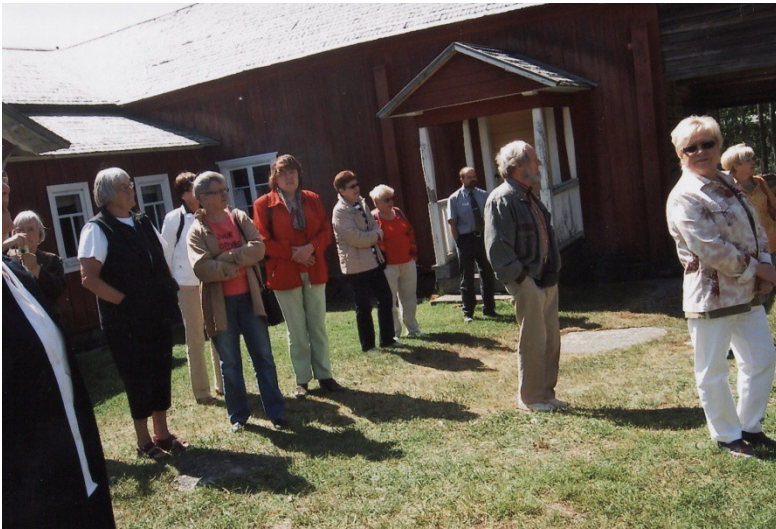
Kesäretki suuntautui tänä vuonna Laitilaan, jossa käytiin muun muassa Perinne kylässä.