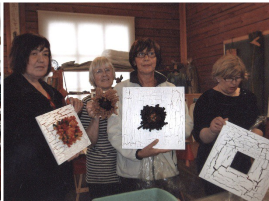
Uvilan Askartelukeskuksessa askarrettiin syksyllä jouluisia koristeita.